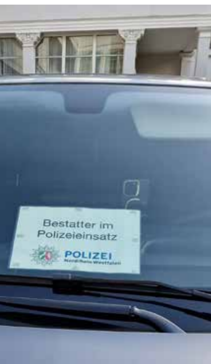
Bei jeder Selbsttötung muss die Kriminalpolizei ermitteln, das gilt natürlich auch bei jeder Beihilfe zur Selbsttötung.

Auch wenn von Seiten der Palliativmedizin – auch von mir – immer wieder betont wird, Palliativmedizin könne Leiden gut lindern, so steht dies in keinem Verhältnis zu dem 0-Leiden beim Einschlafen durch ein Narkosemittel. In normaler Palliativversorgung – außerhalb des Todeseintritts im tiefen Schlaf (ca. 1/3 der Patienten) - gibt es immer diverse Leidenszustände, auf die